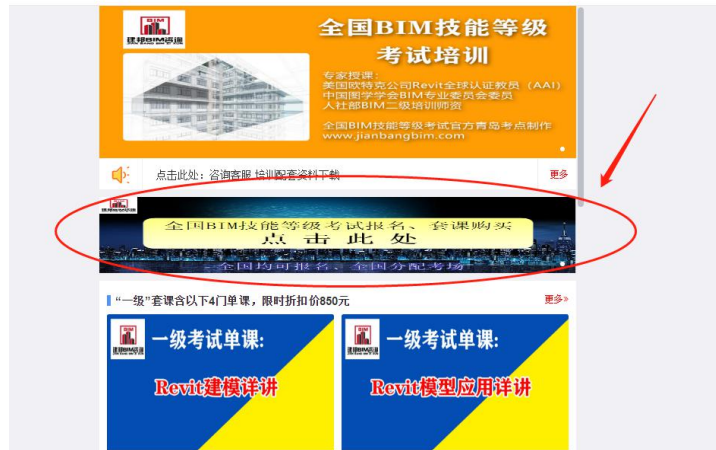
图 3 报名按钮