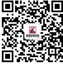
图 1 “建邦 BIM 技术服务”公众号